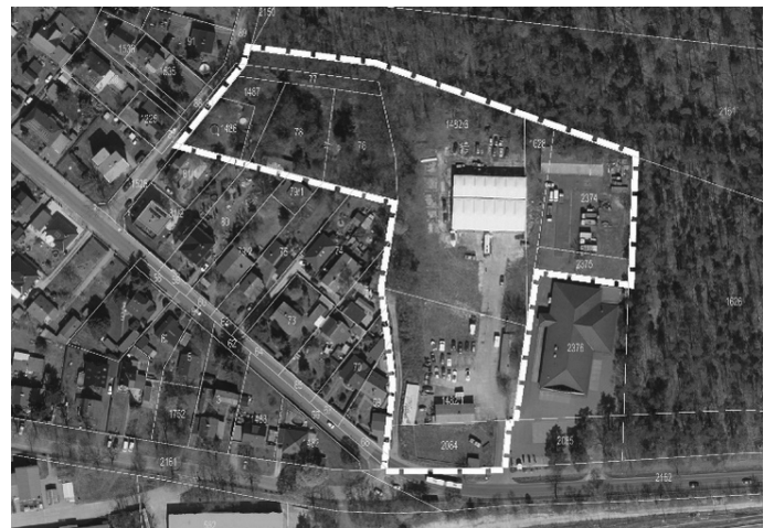
Abbildung 2: Geltungsbereich